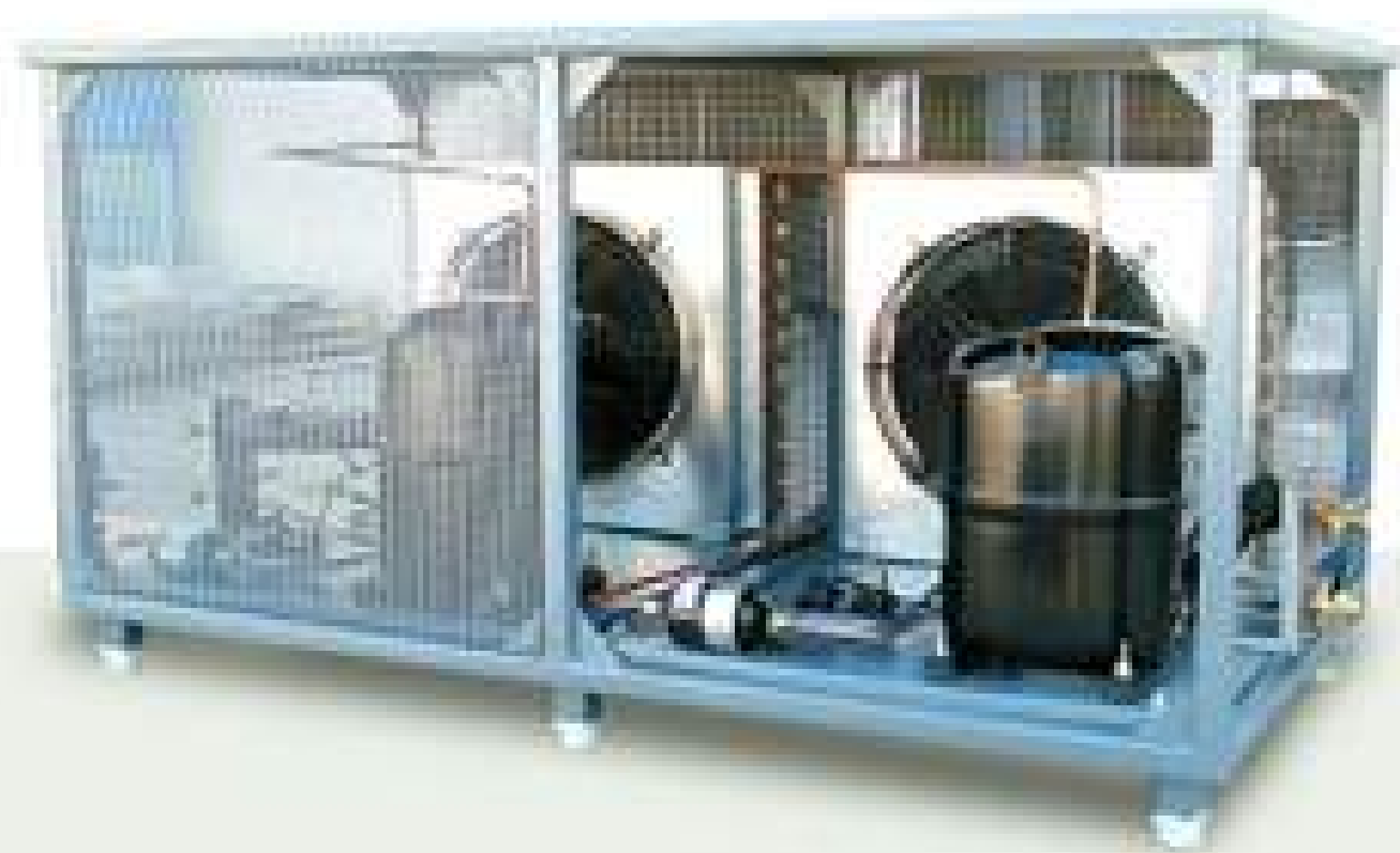
Stand by Refrigeration system